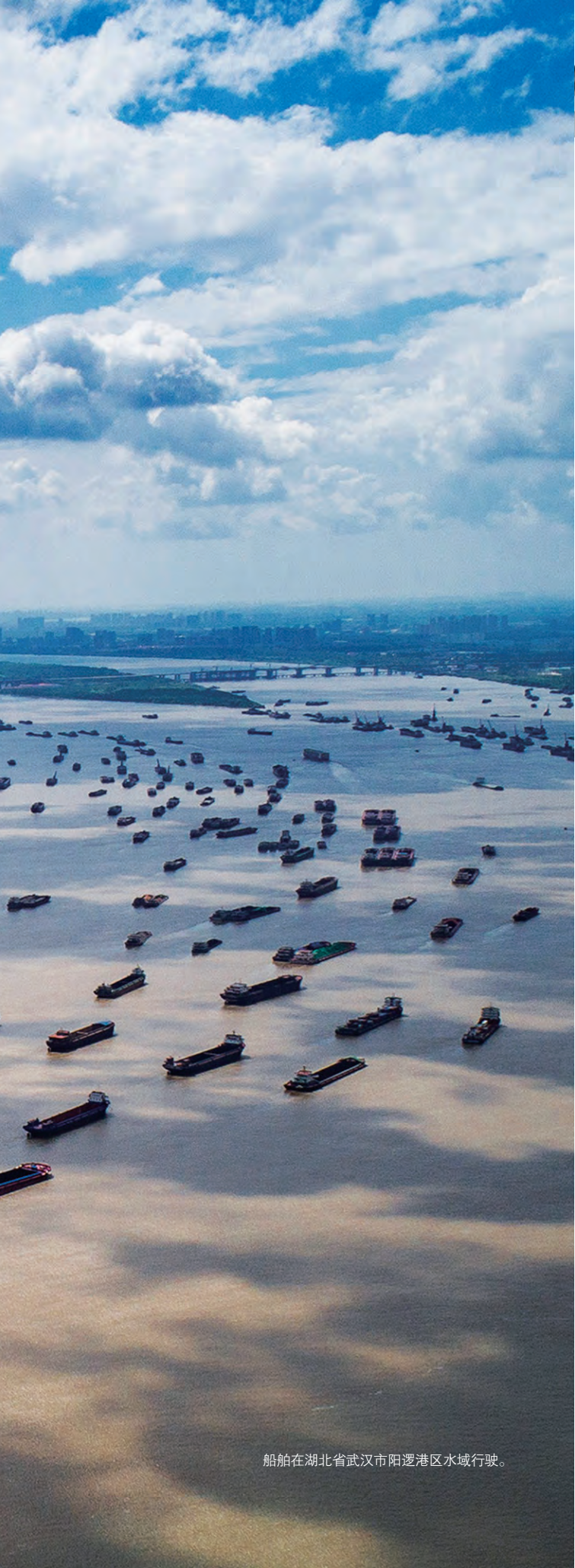
船舶在湖北省武汉市阳逻港区水域行驶。