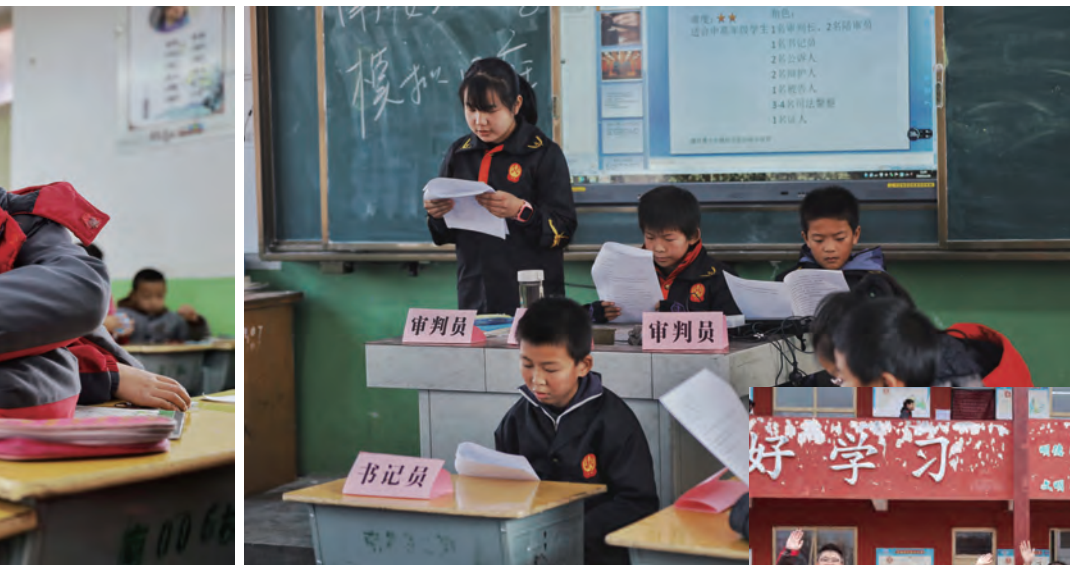
南委泉小学模拟法庭正式开庭。