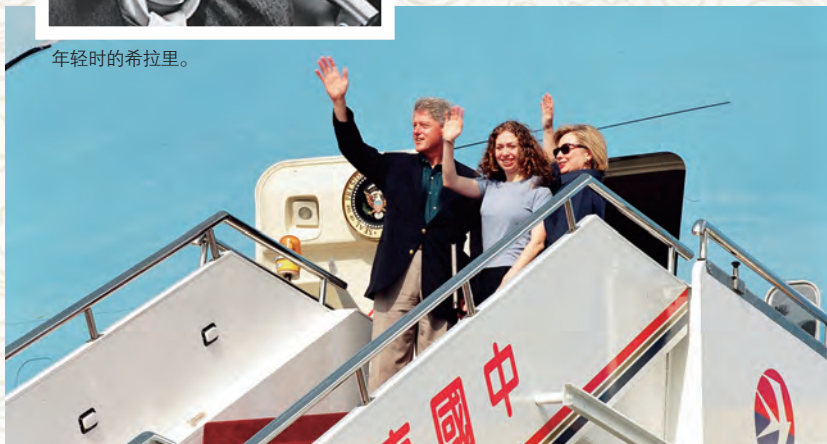
1998年6月30日，美国总统克林顿偕夫人希拉里、女儿切尔西来华访问。