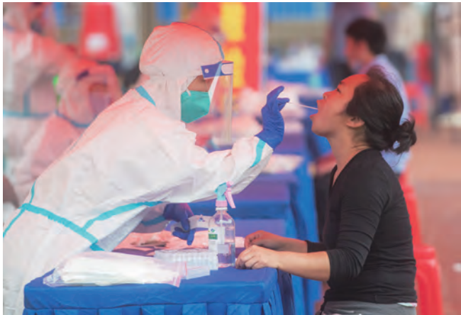
武汉市开展全员核酸筛查。