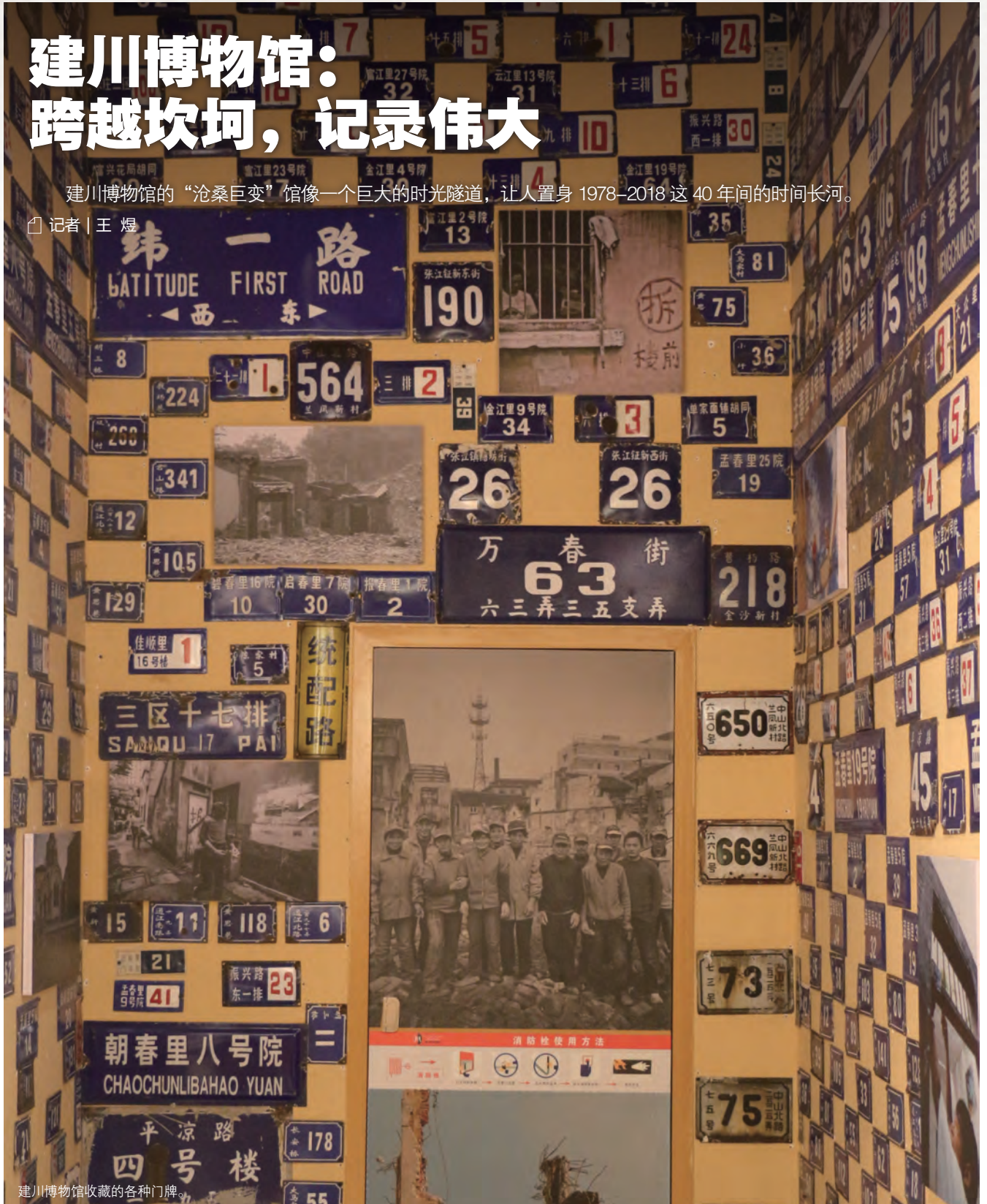
建川博物馆收藏的各种门牌。