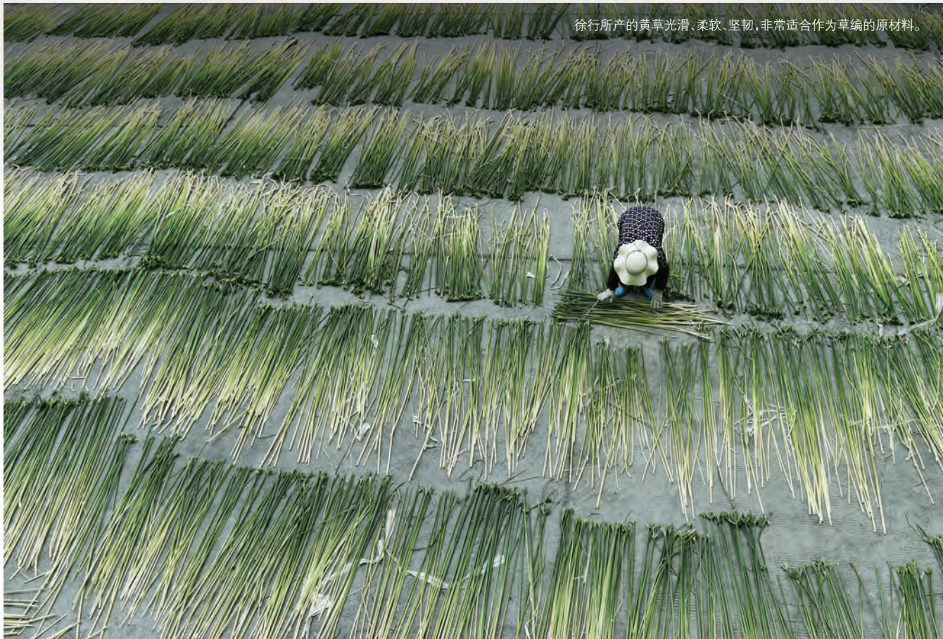
徐行所产的黄草光滑、柔软、坚韧，非常适合作为草编的原材料。