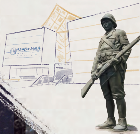
上海观复博物馆金器馆

上海观复博物馆位于上海中心大厦的 37 层，设有 4 个固定展厅：瓷器馆、东西馆、金器馆、造像馆，以及一个临时展厅。宋瓷的繁盛、东西文化结合的魅力、古代金器的光影效果，馆内一切均为上海这座城市量身定做。