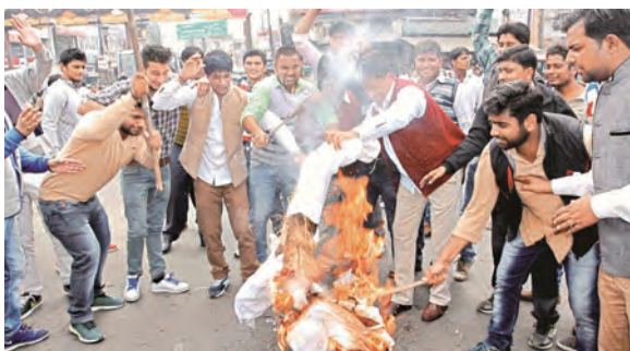
下图：印度种姓问题一日不解决，由此产生的暴力事件就会层出不穷。