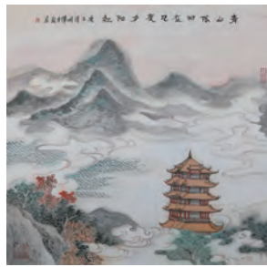
《青山依旧》 绘画：恽青铭