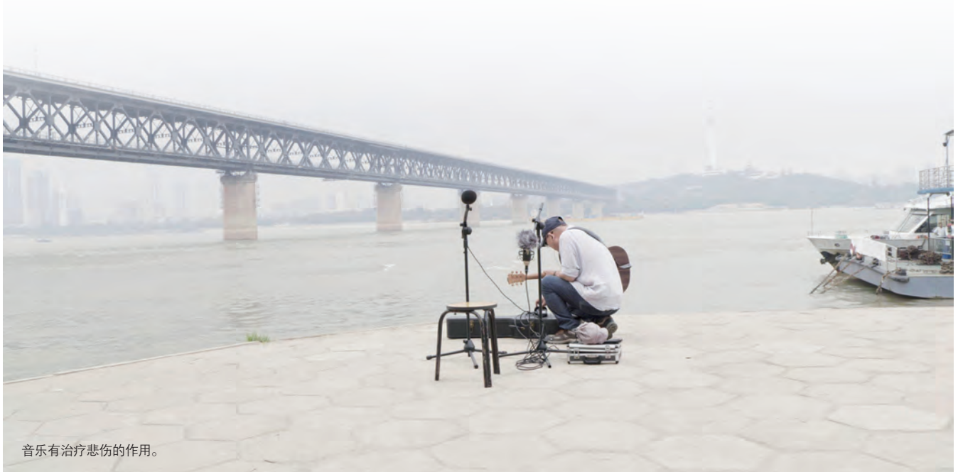
音乐有治疗悲伤的作用。

对于这次疫情，我自己一直都很难过。因为我是医生，更知道这个事情的难度。病毒没有时间让你去想啊，所以，就全世界任何一个国家来说，我们有全世界最好的动员能力、最大的防护用品生产规模，加上后来坚决的措施，有现在的结果已经很好了。