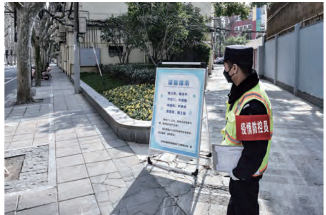
疫情防控员。

们收到了 100 条采购线索里，只有 10 条是有效的线索，再继续追踪下去，可能只有一单能成，甚至一单都成不了。我们有过很多次失败的采购，甚至到了最后一步被厂家跑单的也有，这个时候我们来不及沮丧和愤怒，也来不及追究背后的原因，因为我们急着寻找下一个新的可能。