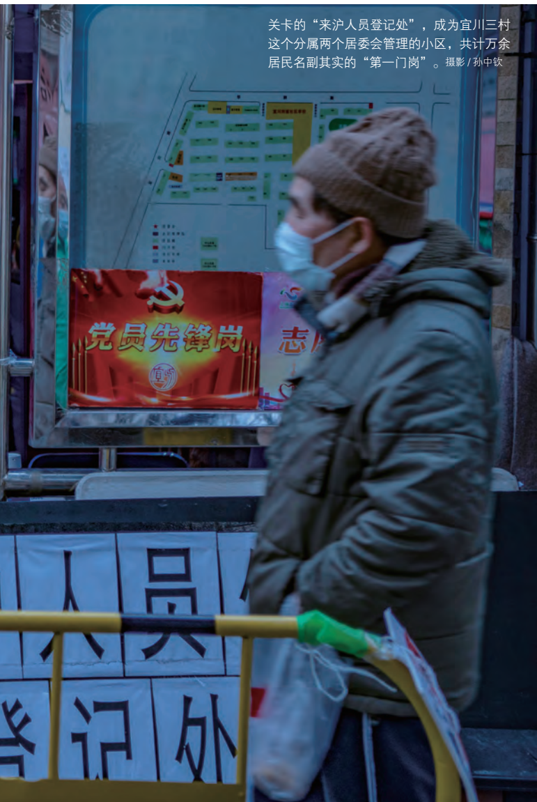
关卡的“来沪人员登记处”，成为宜川三村这个分属两个居委会管理的小区，共计万余居民名副其实的“第一门岗”。

隔离有保障；保障房小区内，居住人员多样，居民区党总支通过两人组队“扫楼”，加强人员排摸力度。