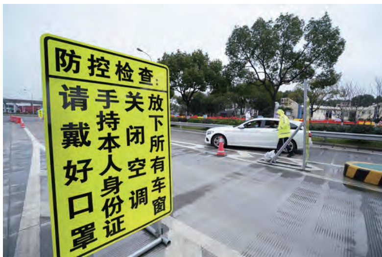
在进入城市的公路、铁路、机场、码头等交通口岸和道口设立了检测点。

对经济的影响，努力完成今年经济社会发展各项目标任务。要抓好在建项目复工和新项目开工。要稳定居民消费，发展网络消费，扩大健康类消费。要积极推动企事业单位复工复产，对受疫情影响较大企业，要在金融、用工等方面加大支持力度，帮助渡过难关。越是发生疫情，越要注意做好保障和改善民生工作，特别是要高度关注就业问题，防止出现大规模裁员。