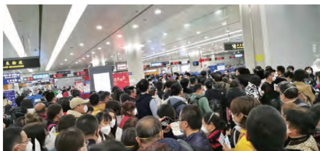
飞机上还有二十几个湖北人。所以回国后的检验检疫流程就很麻烦，我现在也自觉在家隔离。

其实不是我一家，我们这一行对此次新冠肺炎疫情造成的影响都很着急。做我们这一行的主要集中在北京、上海和深圳三地，上海大概有同行大大小小几十家吧。大家一致认为上半年新的项目不会开工，旧的项目何时复工也说不准，应收账款也难以收回。