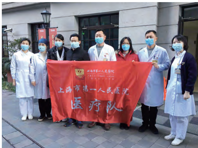
上海市第一人民医院医疗队。