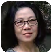
池莉，武汉市文联主席