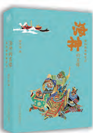
《海神的肖像》 盛文强著 浙江人民美术出版社 2019年9月

盛文强用“内视”一词来形容这种奇异的能力。现代渔民画中的海神形象，与其说是信仰的寄托，不若形容为恐惧的释放。