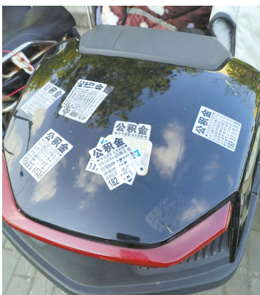
小广告肆无忌惮乱贴

据市民及业内人士介绍,该类广告危害极大,绝非单纯的市容问题。住房公积金是职工专属住房保障资金,依照《上海市住房公积金提取管理办法》,任何单位和个人不得有借代办、代提公积金业务。市民一旦违规套取公积金,需全额退回资金,还将面临罚款、征信受损等处罚,直接影响后续公积