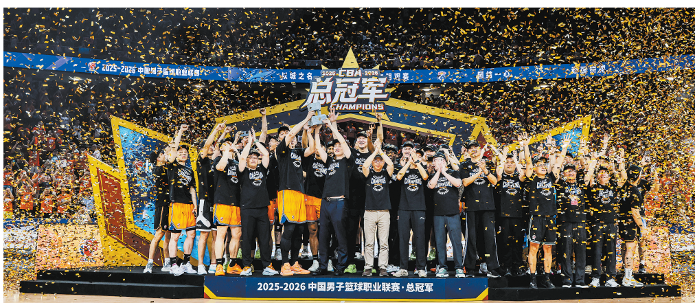
■ 上海男篮昨晚夺冠,现场一片欢腾