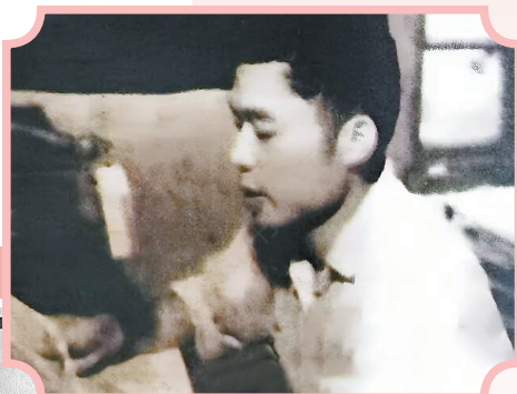
▶ 上世纪七十年代在农场广播室

快要三十岁的爸爸坐在大学中文系的学堂里,他当年在乡下读的一本又一本哲学、文学、历史书,这时派上了用处。他在阶梯教室里闷声不响地写小说,跟他当年写“今日菜单”时一样,全情投入。这些小说散文逐渐在这个杂志那个期刊上发表。