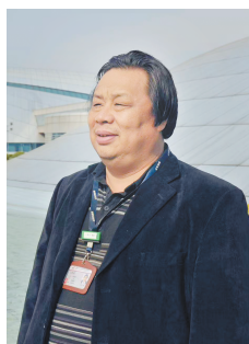
中国科学院上海应用物理研究所原所长徐洪杰