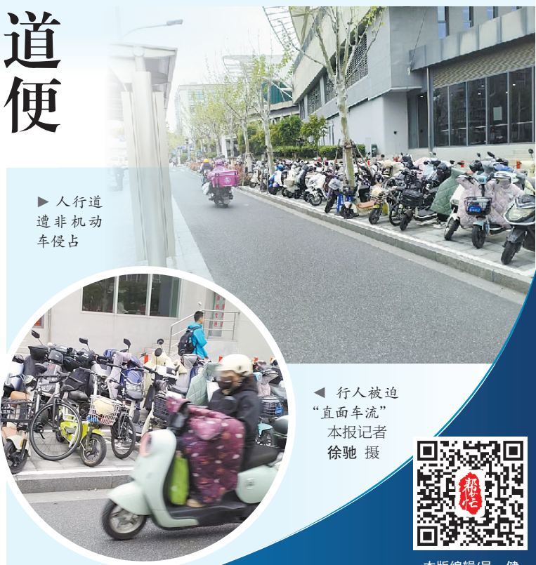
人行道遭非机动车侵占