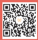
扫码看总决赛现场

24年的等待,上海大鲨鱼用一场荡气回肠的胜利宣告了自己的归来。而真正的考验,才刚刚开始。 本报记者 李元春