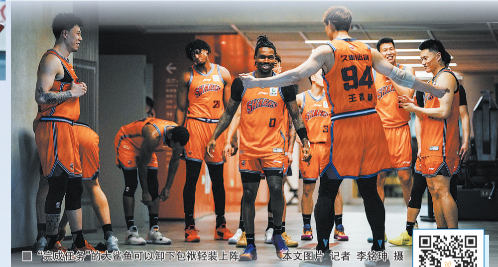
“完成任务”的大鲨鱼可以卸下包袱轻装上阵

大鲨鱼的强势崛起,源自于球队精准而富有远见的布局。豪华且适配的外援组合构成了大鲨鱼的坚实骨架:怀特塞德坐镇篮下,荣膺常规赛最佳防守球