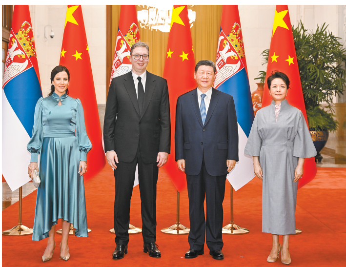
■ 5月25日下午,国家主席习近平在北京人民大会堂同来华进行国事访问的塞尔维亚总统武契奇举行会谈。这是会谈前,习近平和夫人彭丽媛同武契奇和夫人塔玛拉合影