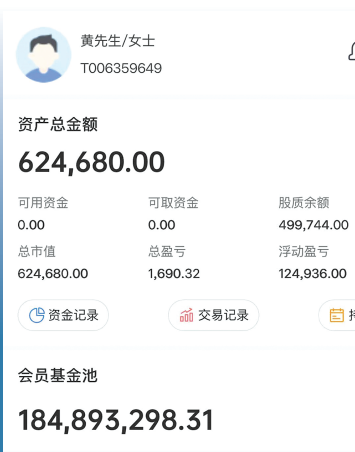
黄女士App中的资产总金额停留在624680元

黄女士并不知道，此刻她已不知不觉掉进了“杀猪盘”中。很快“基金经理”和“经理助理”开始放风，说公司准备布局一只大股票，