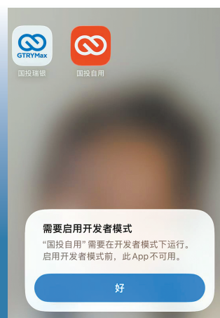
黄女士的国投瑞银App和国投自用App如今都无法打开