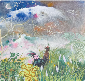
弯月与公鸡 (水彩) 朱丹

食饼筒是当地的顶级硬核早餐,但怎么让我去酒楼吃早饭?或许荣华楼就是一个小吃摊的名字?第二天一早,我就打车到桔乡大道,大吃一惊,这哪是什么小吃店,明明就是一家很有规模的大饭店,但这大饭店真的只卖食饼筒和各种粥、汤,我也见到了食饼筒的真身,它形似放大版的春卷——一头封闭、一头开放,馅料丰富,炒米面、豆腐干、卷心菜、猪