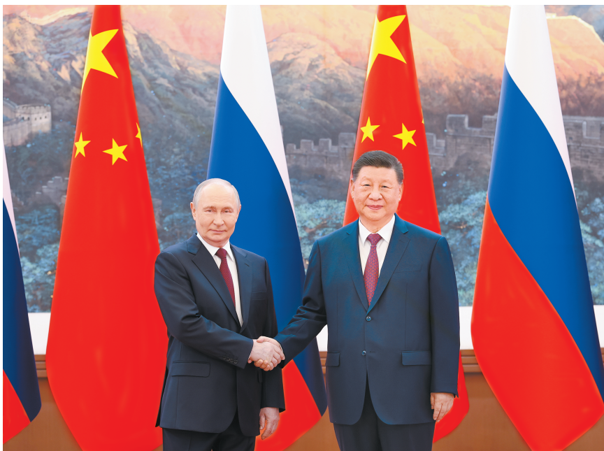
■ 5月20日上午,国家主席习近平在北京人民大会堂同来华进行国事访问的俄罗斯总统普京举行会谈