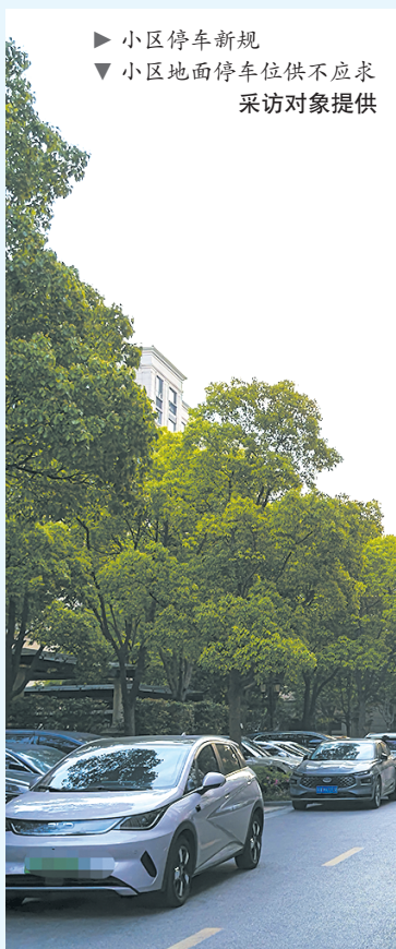
▶ 小区停车新规 ▼ 小区地面停车位供不应求