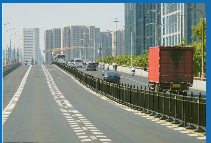
岚皋路立交桥上的隔离护栏安装完毕