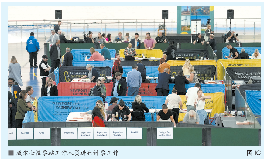
■ 威尔士投票站工作人员进行计票工作

曼彻斯特大学教授斯科特表示,工党在哈特尔浦、坦姆赛德等传统票仓失利,对“心脏地带”选民支持构成打击。在许多选民看来,工党和保守党越来越缺乏差异,从而转向