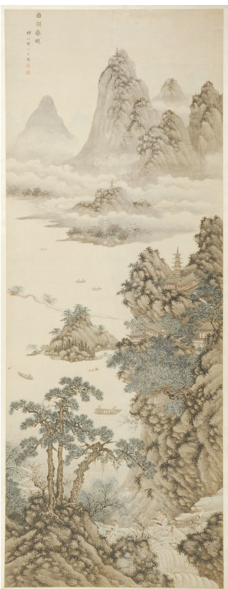
■ 明代谢时臣《西湖春晓图》轴

堤畔新柳扶风，柔丝如烟，惹人吟诵白居易“最爱湖东行不足，绿杨阴里白沙堤”的诗句。湖中孤丘静立，杂树葱茏，临水亭阁隐约掩映。画面右侧奇峰雄峙，山间塔楼巍峨，屋舍亭台依山傍水而建，藏于苍松翠柏之间，林木葱郁，意境清幽旷远。湖面画舫悠然游弋，游人安坐舱中赏景；船夫撑篙泊岸、驾舟泛