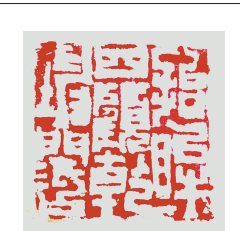
拾眸四顾乾坤阔 篆刻 唐子农