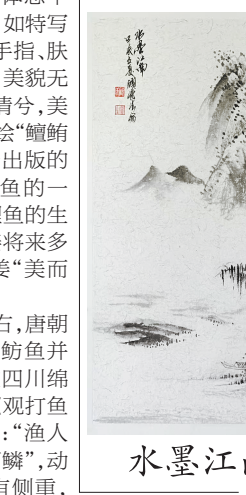
水墨江南(中国画) 顾党生

晚高峰的地铁挤得人喘不过气,一个女生扶住我一靠,侧头看向身边的男生说:“今儿个我都无力吐槽,领导让我带着新同事做个汇报,我其实都做得差不多了,新同事核查查结果就能完事,步骤已经教过两次了,你猜咋的?! 新同事追着问,连筛选数据都要一步一步截图标注,我就差给个Excel表说明书了。”男生嗤笑一声:“这算啥,我上周带的实习生,让他整理一份客户资料,我把模板、参考案例都发给他了,结果他交上来的东西,连客户姓名都抄错了,问他怎么回事,他说‘你没明确说要核对啊!’”女生叹了口气:“可不是嘛,现在好多人工作时一点都不动脑子。我前阵子听我姐说,她们公司有个小姑娘做项目方案,领导把框架、核心要点都列好了,让她补充细节,她居然问‘细节怎么写? 你给个范本我抄’,最后这工作就变成别人的了。” “我想起刚工作那年,我师傅带我做项目,只给我指了个方向,让我自己查资料、做调研,我当时也慌,熬夜查了三天,踩了不少坑,最后虽然做得不完美,但至少摸清了门路。现在再看那些新人,别说自己查资料了,连现成的资料都懒得看,就等着别人嚼碎了喂饭吃。”男生继续说。女生沉默了几秒,忽然感慨道:“现在的AI都能深度思考、自主学习,可我们这些活人,反而活成了预制人。”男生点点头:“自主学习能让我们保持基础的逻辑思维能力,遇到问题时,不会只想等着别人教没教,而是自己有能力去解决。就像我师傅当年对我那样,不喂饭,只引路,反而让我成长得更快。” 地铁到站,人流涌动,春天的晚风拂过脸颊,我感觉自己的疲惫也消散了几分。是啊,与其等着别人喂饭,不如自己学会觅食,才是最靠谱的。