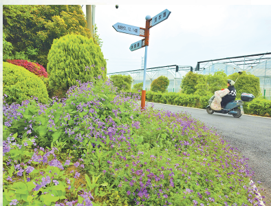
村内绿化颇具特色