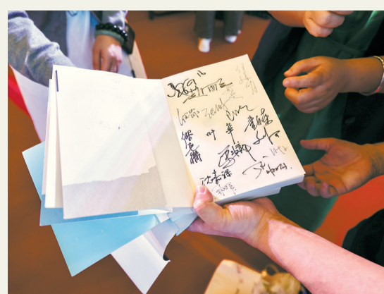
▲ 读者在去年的文粹发布会现场喜得签名本