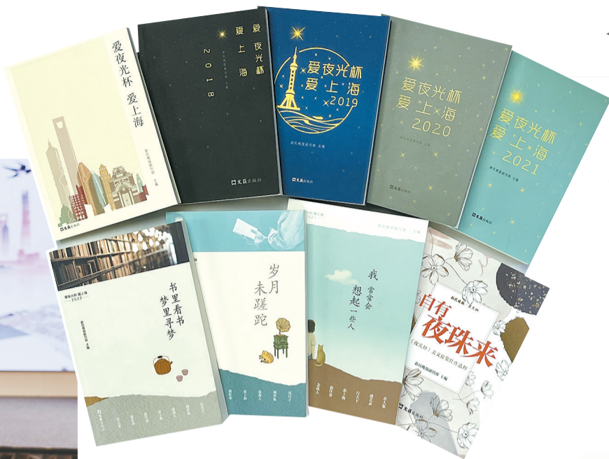
《夜光杯》文粹《爱夜光杯 爱上海》系列书影