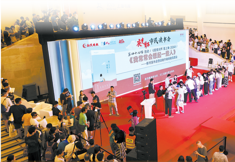
现场，读者排起回字形长龙 ▲ 去年《夜光杯》新书发布会签售

悠悠往昔，葡萄美酒，为读者添夜夜光华；我们期待，如灿今朝，举杯同饮，与你共灼灼繁花。