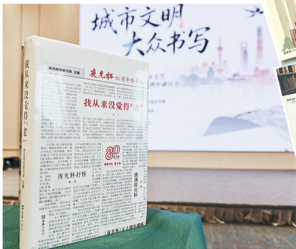
▲ 4月29日，“城市文明 大众书写”——繁荣新大众文艺暨《夜光杯》创刊80周年研讨会上，新书亮相