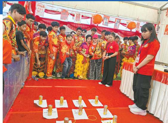
▲ 中柬文化缤纷游园会在柬埔寨金边举行