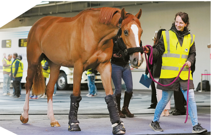
骏马抵达上海马术谷

心难题。得益于中欧双方的持续努力及各合作单位的通力配合，上海比赛区域最终被欧盟认可为“临时非疫区”，通过运输数据管理、动物疫病监测、隔离检疫、封闭监管等一系列举措，赛事得以在上海连续多年成功举办。其中，上海海关提前对接欧盟赛马检疫要求及兽医卫生证书标准，优化业务系统与通关流程，大幅提升通关效率；上海市农业农村委员会、上海机场(集团)有限公司、上海市公安局国际机场分局、上海出入境边防检查总站等单位协同发力，建立常态化协作机制，