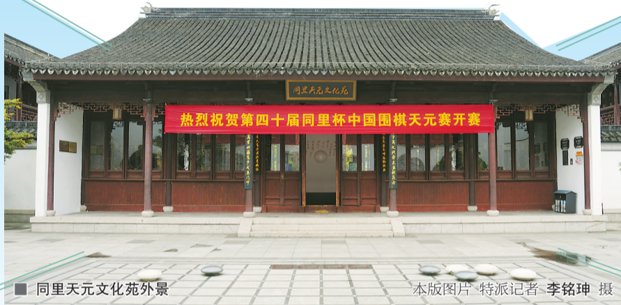
■ 同里天元文化苑外景