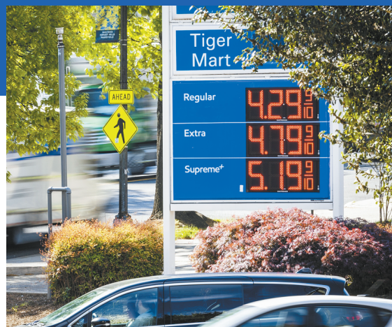
▲受中东局势持续紧张影响,美国加油站的油价上涨 ◀船只在霍尔木兹海峡航行

美国和以色列2月28日对伊朗发动军事打击后,战事波及中东大片地区。4月8日,美国与伊朗实现临时停火,此后两国在谈判问题上陷入“拉锯战”。