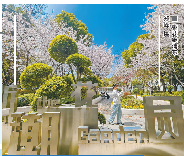
繁花绽浦东

2026年,站在“十五五”规划开篇的关键节点,浦东正以更高水平的开放倒逼改革,以更具温度的治理回馈人民。从繁花似锦的商圈到碧波荡漾的“五环”水脉,从半小时直达的枢纽交通到“环上”绽放的生态公园,一幅人民城市新画卷,正在浦江东岸徐徐展开。