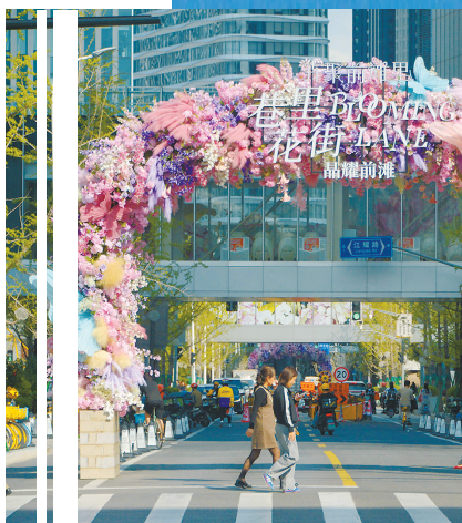
▲ 前滩巷里花街

“五环”建设不仅是浦东精品城区建设、城市更新提升、超大城市治理和民生保障的重要项目,更是一场精细入微的社会治理实践。打通被小区、企业长期围合的滨水“堵点断带”,是其中最艰巨的任务。在陆家嘴水环贯通中,家化滨江苑小区的案例极具代表性。为了腾出宽8至10米的滨水空间,项目方与法律意识较强的居民们开展了多次“一对一”沟通。最终,居民们同意“让”出小区里的步道贯通空间,换取了2.5米宽的公共步道和24小时的“人防+技防”安全保障。