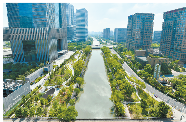
陆家嘴水环

在提升“水脉”质效的同时,浦东的生态底色正被不断擦亮。2026年新年伊始,横沔、凌桥、洲海、唐韵、新丰5座环城生态公园齐亮相,标志着浦东“十四五”期间16座环上公园建设任务圆满收官。