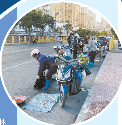
▲大清早,流动摊贩就在桥上占地盘