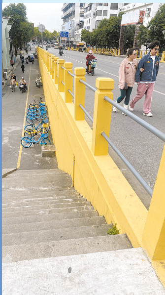
▲专用人行道坡度较陡,许多行人直接在机动车道上行走