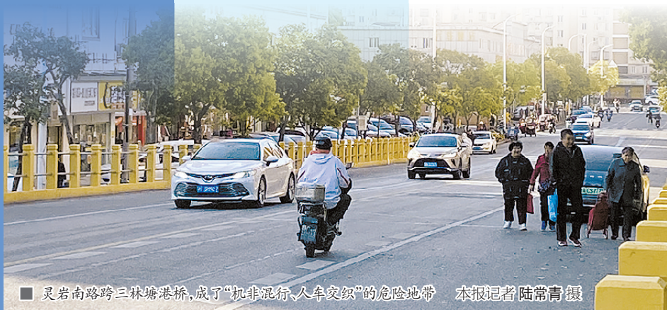
■灵岩南路跨三林塘港桥,成了“机非混行、人车交织”的危险地带