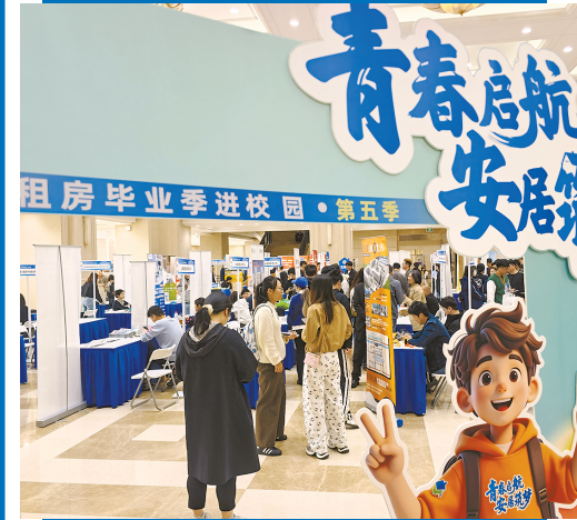
活动现场吸引不少学生咨询了解

专项活动期间,“保租房进校园”“海聚英才通”“青春上海”“上海12355”“上海学生事务”“上海学联”“浦东明珠在线”等七个线上平台同步发布相关活动信息或接受在线办理服务。