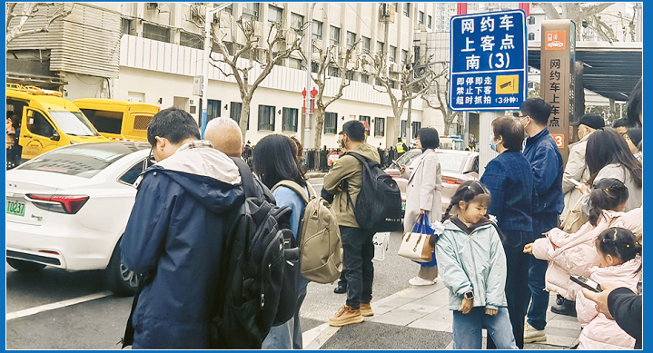
▲ 上海火车站网约车上客点,等候的乘客不知道自己所乘的网约车是否合规

掏出手机,用打车软件订一辆网约车,你是否留意过它“人车双证”可齐全?坐上不合规网约车,安全、服务、价格、维权不靠谱的情况屡屡发生。针对网约车市场当前的种种乱象,上海交通执法部门正持续深化整治。