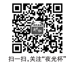
扫一扫,关注“夜光杯”

若给春天赋予MBTI人格,我想,它定是热烈张扬、毫无保留的ENFP。它不像远山那般沉静沉稳,静默伫立,而是带着满腔热忱,奔赴而来,踪迹昭然;离去时虽干脆利落,可只要你敞开心扉,张开双臂,便能与它撞个满怀。即便你刻意闭眼,佯装无视,耳畔婉转鸟鸣、鼻尖沁入芬芳,也会悄悄提醒你,早已误入春深处。既然如此,何不放下牵绊,尽情沉醉,尽兴而归?