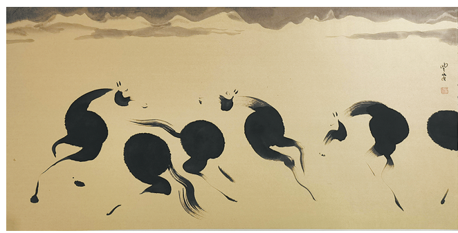
（纸本水墨）兴 安 激舞