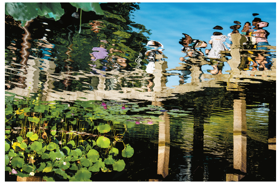
镜水映影 沈洪 摄于古猗园