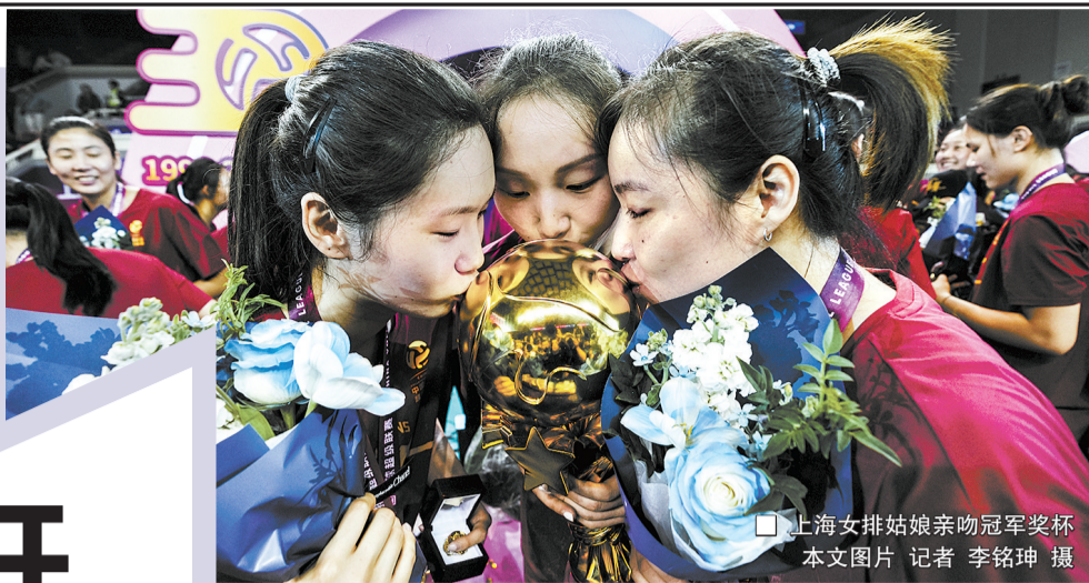
上海女排姑娘亲吻冠军奖杯