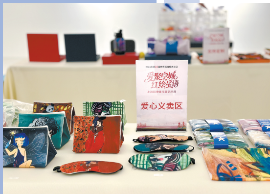
■“星宝”画作被制成文创礼品,接受定制