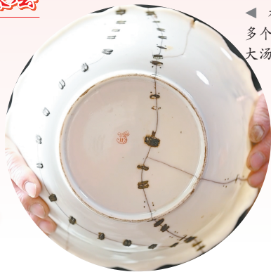
◀ 补了50多个铜钉的大汤碗