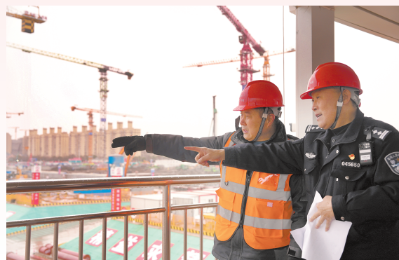
■ 老陆是工地上的“活地图”

“这时候老妈发话了，说小人要懂规矩，不管肚子有多饿，盛饭都有定数。”他告诉记者，当时农户人家能吃上纯米饭的机会不多，除了春节、芒种前后的农忙和亲戚来访的第一顿之外，一年四季中的大部分时候都吃玉米棒做